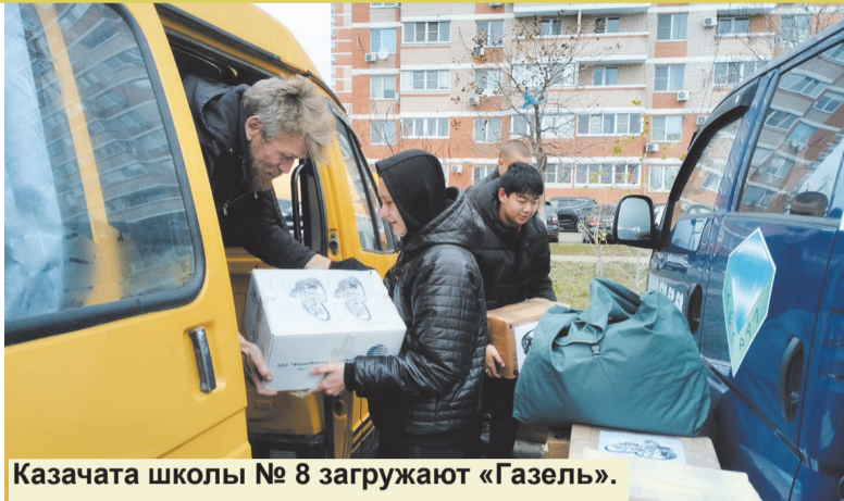
Казачата школы № 8 загружают «Газель».

— Большую часть средств перечисляют мои одноклассники и сослуживцы. Жизнь разбросала команду атомной подводной лодки, на которой служили, по всей стране — от