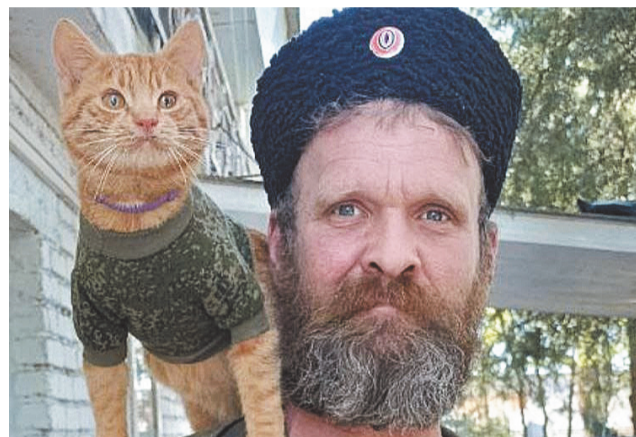
Казак ХКО «Красный Кут» и боевой казачий кот Кузя.