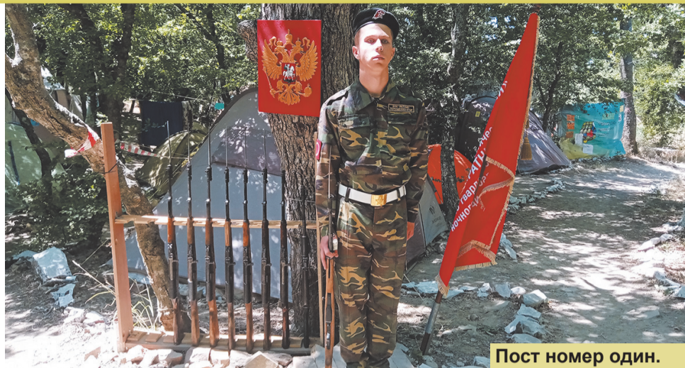
Пост номер один.

— Я рад встрече с вами. Говорю не ради красного словца. Пройдет время, и вы будете строить и защищать нашу великую Россию. Во все времена государства Российского казаки показывали образцы мужества и