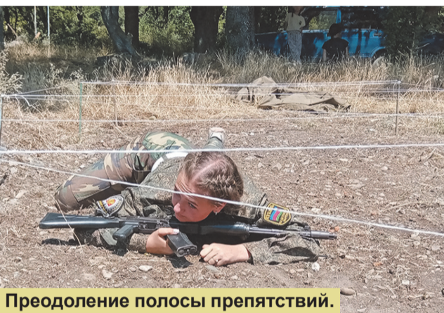
Преодоление полосы препятствий.